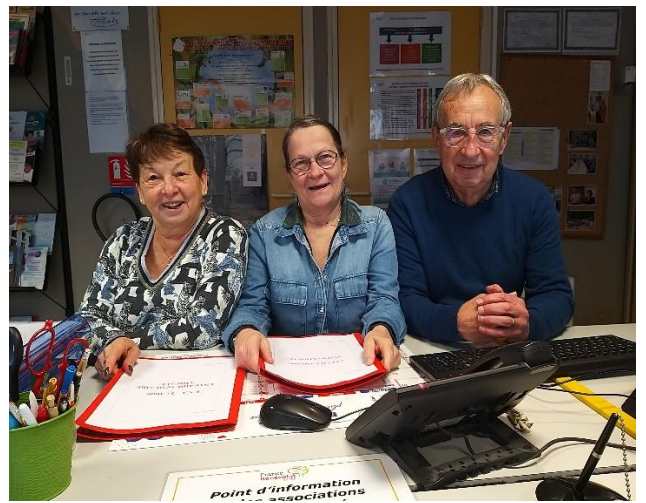
Dans le cadre de cette semaine de la solidarité, trois bénévoles ont tenu une porte-ouverte à France Bénévolat Sarthe.